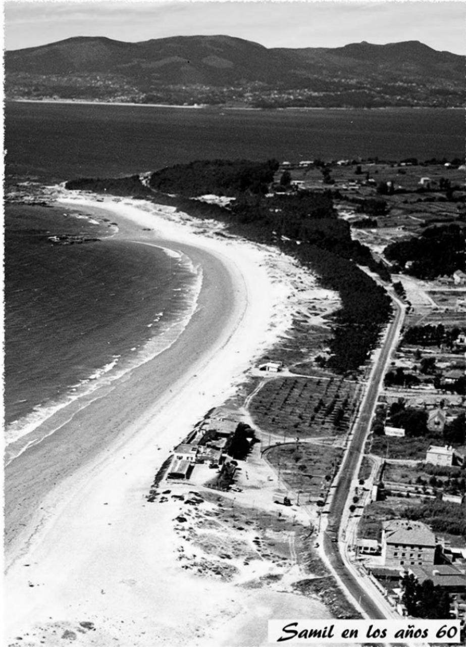
Samil en los años 60